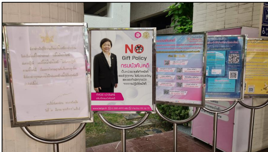
ติดบอร์ดประชาสัมพันธ์ เพื่อเผยแพร่ภายในหน่วยงานกรมบังคับคดี